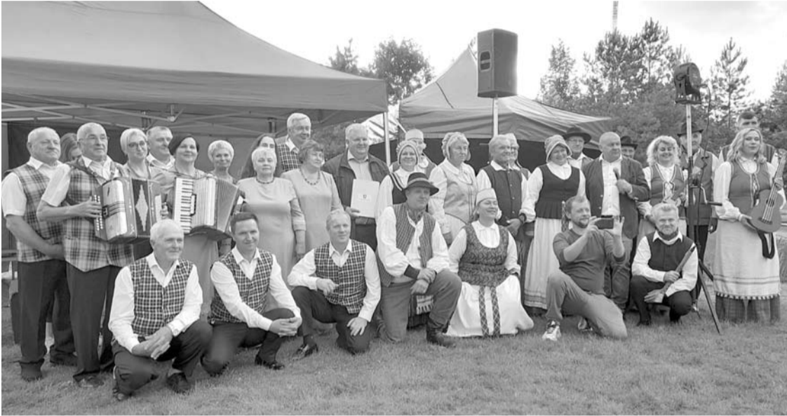
Į Viešintas atvyko kapelos iš įvairių Lietuvos kampelių.