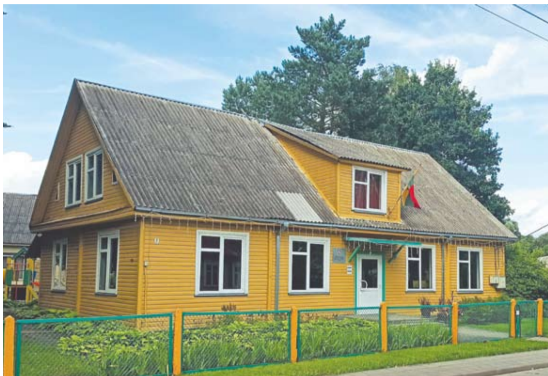
Dabartinis Troškūnų Kazio Inčiūros gimnazijos ikimokyklinio ugdymo skyrius įsikūręs miestelio centre.

Vidmantas ŠMIGELSKAS vidmantas.s@anyksta.lt