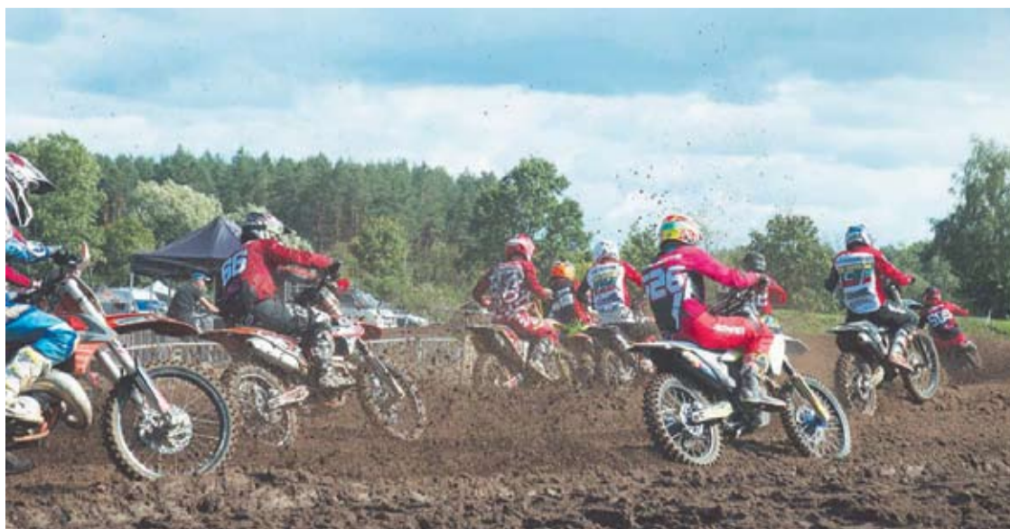
Lietuvos motokroso taurės penktojo etapo varžybos buvo tarptautinės, startavo ne tik lietuviai, bet ir keli sportininkai iš Latvijos.

Vidmantas ŠMIGELSKAS vidmantas.s@anyksta.lt