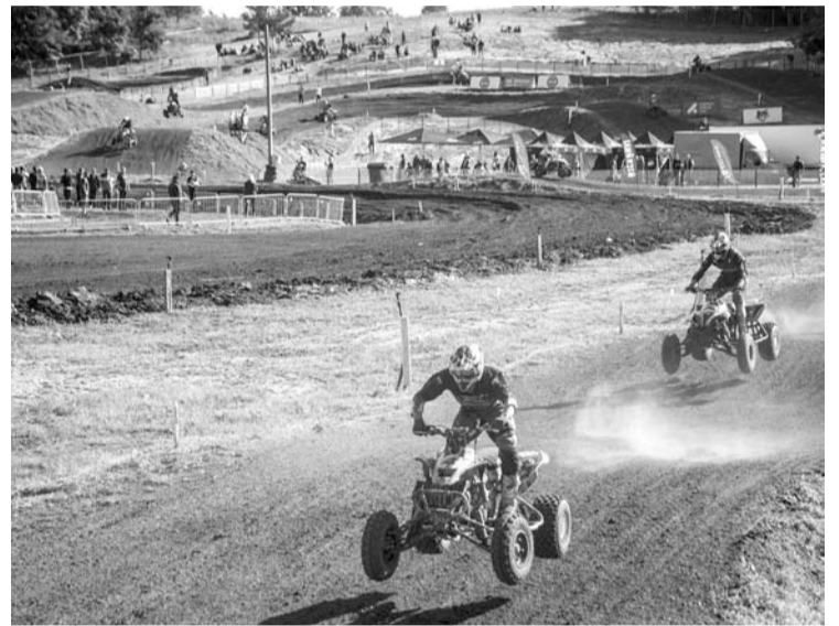
Įmirkusi trasa sportininkams buvo sunkiau įveikiama, mažėjo lenktyninukų greičiai.