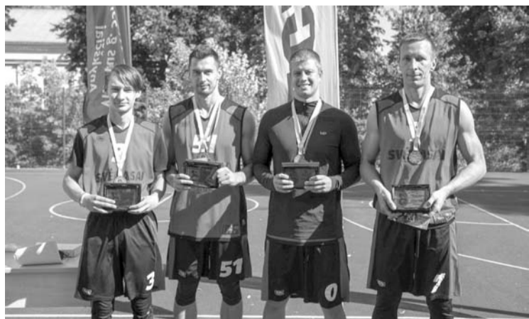
Atvirojo Anykščių rajono krepšinio 3 prieš 3 čempionato nugalėtoja tapo Svėdasų komanda.