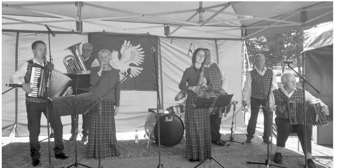
Viešintų kapela „Vingerinė“ žiūrovams padovanojo keturias dainas.