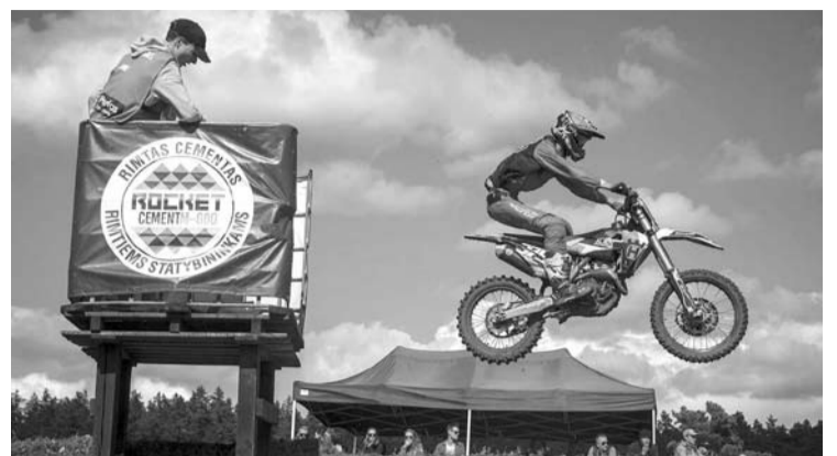
Šeštadienį vykusios Lietuvos motokroso taurės penktojo etapo varžybos - antrasis motociklų sporto renginys šiemet Mickūnų trasoje.